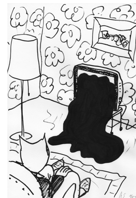
Insta Dessin ( Télé asphalte ), 2019. Acrylviltstift op papier. Courtesy van de kunstenaar en Galerie Laurent Godin, Paris