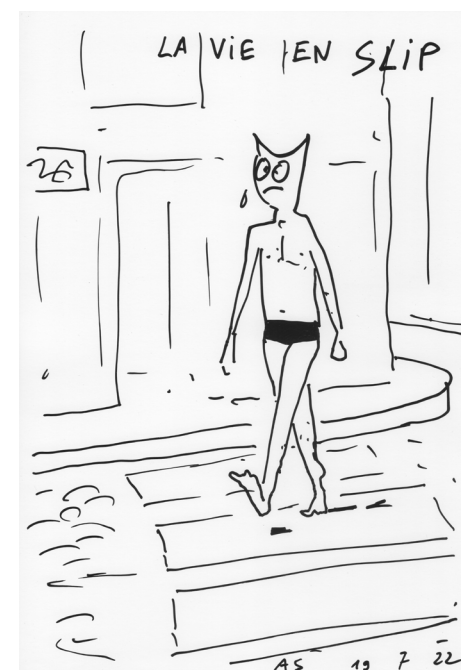
Insta Dessin ( La vie en slip ), 2022. Acrylviltstift op papier. Courtesy van de kunstenaar en Galerie Laurent Godin, Paris

Jean-Auguste-Dominique Ingres (1780-1867) en Eugène Delacroix (1798-1863). Tekenen werd lange tijd ten onrechte ondergewaardeerd. Men beschouwde een tekening slecht als schets of de voorbereiding op een schilderij. Sommige tekeningen werden echter puur gemaakt omdat iemand tekeningen wilde creëren.