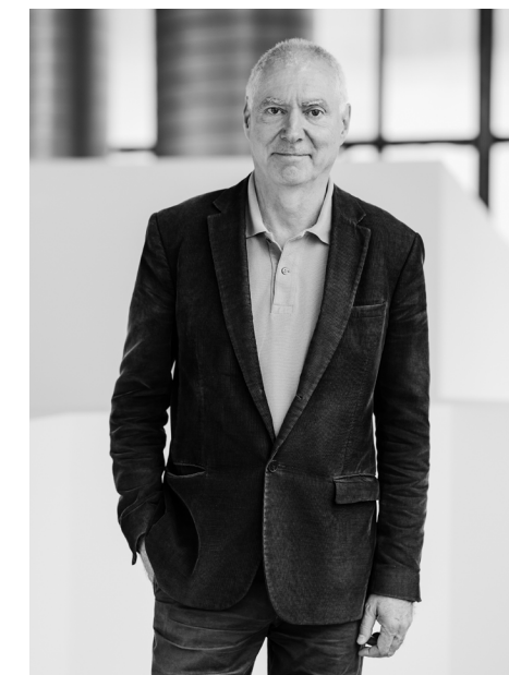
Portret van Alain Séchas in het BPS22, 2024.