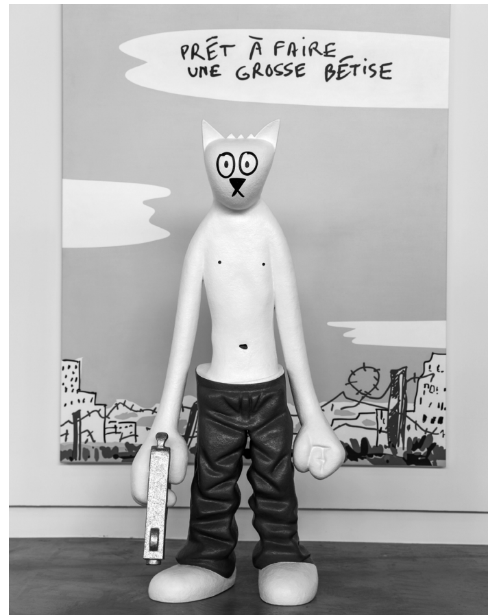
Grosse Bêtise, 2003. Polyester, acryl op doek. Collectie van de Provincie Henegouwen, in depot bij de BPS22.

Platée Platée is de naam van een personage uit het gelijknamige 'ballet bouffon' van Jean-Philippe Rameau (1683-1764), over de liefde tussen haar en Jupiter. Dit stuk werd geschreven ter ere van het huwelijk van Lodewijk van Frankrijk en Infante Maria-Theresa van Spanje. Het kunstwerk toont de lelijke en zelfingenomen Kikkerkoningin uit het stuk, Platée, die wordt beïnvloed door goden die haar laten geloven