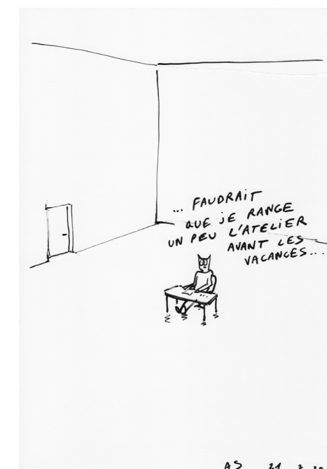
Insta Dessin ( Faudrait que je range un peu... ), 2020. Acrylviltstift op papier.