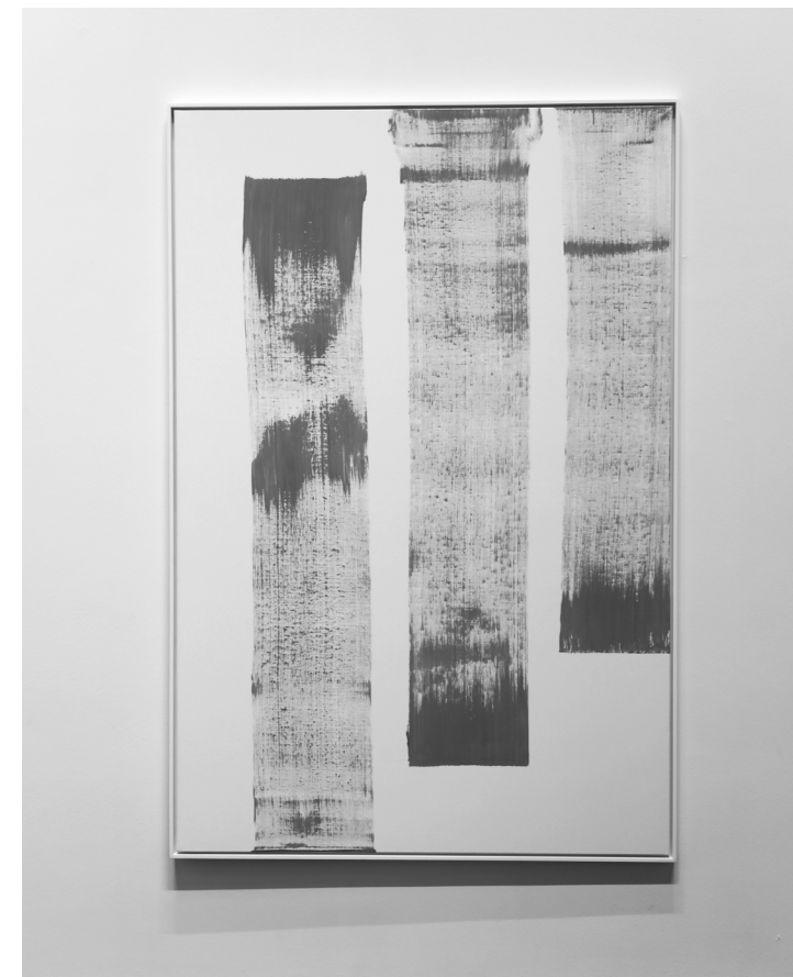
Concorde 1 , 2023. Acryl op doek. Courtesy van de kunstenaar en Galerie Baronian, Brussel. Foto BPS22

Monument pour Jacques Lacan , een werk dat persoonlijkheidsstoornissen, waaronder gespletenheid, visualiseert. Petit Baldaquin en La Cycliste zijn miniatuurmodellen van de grote monumentale werken in de openbare ruimte. Het laatstgenoemde werk staat in Brussel, tegenover de Koninklijke Sint-Hubertus Galerij. Deze grote werken staan niet op een sokkel en vallen de toeschouwer meteen op, net als het beroemde Les Bourgeois de Calais van Auguste Rodin (1840-1917). Hugh Chat Guitariste daarentegen illustreert een geluidloos optreden vanaf een podium dat als sokkel fungeert.